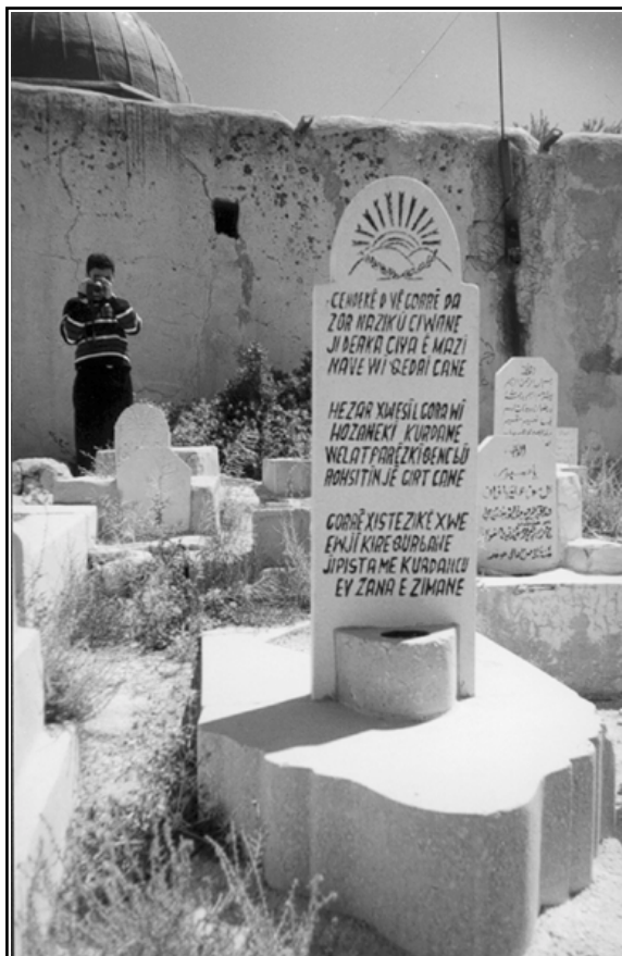
گوڤری قه‌دری جان له شام ئەو شیعەری که له‌سه‌ر کیتلکه‌ی نووسراوه‌ی (عیزه‌ت ئا‌غایێ دێرکی) یه.